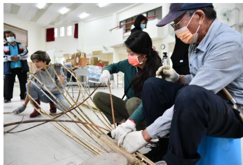
圖 17 在部落頭目指導下製作魚筊