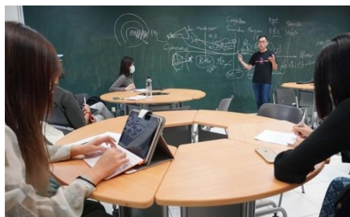
圖 12 博班實驗室系列講座「不相容的思想：遺產及其遞歸」講座前讀書會情形

自 107 年起集合校內音樂、美術、戲劇、舞蹈及文化資源 5 學院博士生共同構築博班實驗室（網址： https://www.tad-lab.net/ ），5 年來累積了 10 個系列講座，針對當代藝術思想與跨科際知識生產，打造全校性跨領域交流與對話場域，俾使校務在學術研究、展演發表注入嶄新活力，躍升亞洲當代高等藝術教育發展先驅。111 年主題「連結 connection」、「Artistic Research 藝術創作研究工作坊」、「不相容的思想：遺產及其遞歸」，邀請國內外知名學者進行學理與研究主題分享，亦針對青年學者分享其研究、求職經驗，提升北藝師生的研究質量。