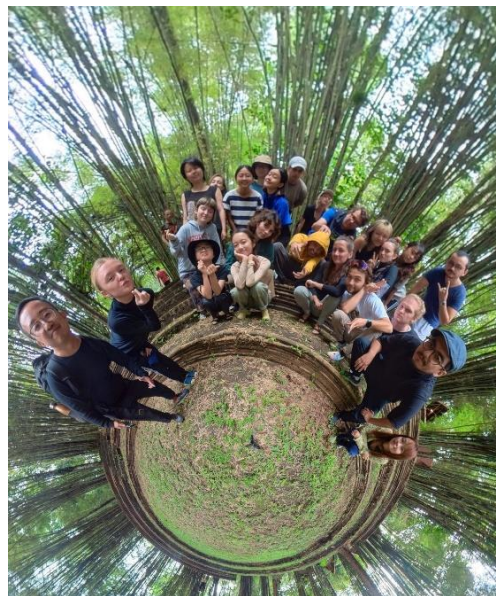
圖 2 共享校園「跨文化合作課程」

學，從中培養學生問題意識及研究探討之發展創作。本課程由本校及世界各地 7 所藝術校院共計 30 名學生參與，並由 22 名藝術家(參與學生)於印尼共同完成 8 場跨域計畫，進行展演呈現，累積參與人數約 100 人。另外，111 年生態思辨 Critical Ecologies 課程由本校教授協同澳洲蒙納許大學及蘇黎世藝術大學同步進行，並安排為期約 2 週之課程，讓學生分別在各地實際踏查，透過線下探勘及線上連結的方式，描繪過去、現在和未來事件同時發生的過程，以探討環境及社會系統之間的關係。另外也舉辦了為期 2 日跨國研討會及配合「藝術出版課程」出版相關藝術書籍 1 冊，共計 94 位師生參與其中。