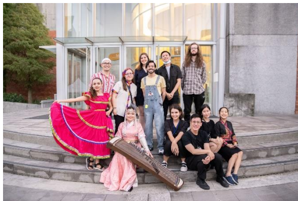
圖 14《2022 文化嘉年華》外籍生合影

透過美食、特色手作、多元文化之音樂、舞蹈與視覺呈現，讓 2022 北藝大文化嘉年華陪伴來自各國的與會者，共渡一場溫馨又豐富的藝術嘉年華。