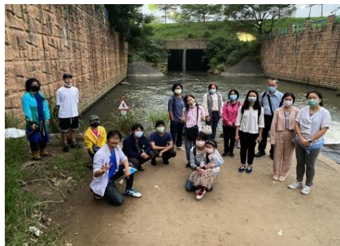
圖 5 公司田溪行動開幕紀錄

由美術學系主辦開設行動教室課程與展演實務選擇鄰近之淡水河為主要研究和創作的對象，透過閱讀藝術表現、文化層積等諸多文本進行爬梳與考證，作為連接藝文生態與重塑地景、文化的共同想像藍圖。111 年「公司田溪行動」計畫以淡水河流域為研究和創作核心，讓藝術課程走出校園，透過身體力行的探查、訪談、工作坊與座談關注環境變遷，並且以創作和展覽實踐，讓藝術事件連結在地社群。選修學生共 15 人，辦理 1 場校外公開成果展演、5 場相關工作坊與活動講座，總參與人次約 223 人，與淡水地區居民以及地方組織展開新對話。