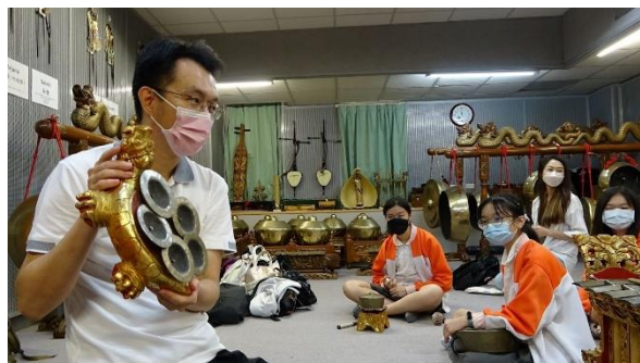
圖 15 丹鳳國中北管社一甘美朗上課

從丹鳳國中北管社團學生參與「傳統音樂體驗」後，所填寫的問卷回饋裡得知，具有北管樂學習背景的國中生，在接觸新的不同音樂類型的學習後，能擁有甚麼樣的音樂記憶留存在他們的心裡，也增加學生對傳統音樂的廣度認識。