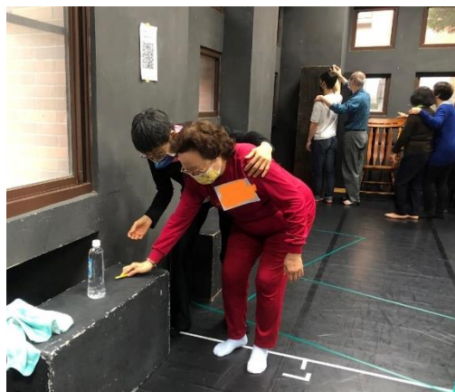
圖 10 師大銀齡樂活據點的長者們到北藝大進行藝術活動工作坊