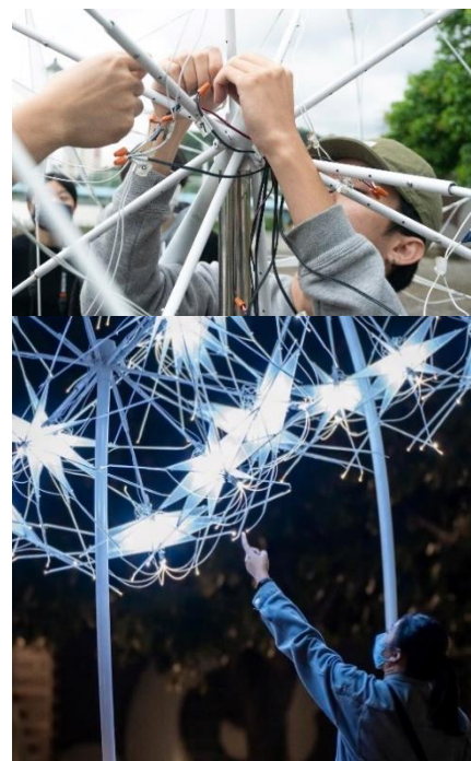
圖 8 關渡光藝術節《濟濟》學生創作新媒體裝置藝術

歷年由新媒體藝術學系規劃主辦，開創利用非典型藝術場域跨界展演的可能性。107 年《游泳克》與 108 年《壞運動》於北藝大游泳池展演、109 年《量子糾纏》在關渡美術館及周遭環境創造全新的展演空間、110 年與校園達文西餐廳跨域合作。關渡光藝術節是新媒體藝術學系對於「什麼是跨領域藝術」不斷的追問與實驗，並透過顛覆場館與藝術體驗的大型新媒體劇場實驗的成果，連續 7 年由新媒體藝術學系師生、校友合作，引進業界專業師資與設備資源，透過展演實務課程的開設與工作坊運作，培育學生專案製作與實務能力，建置學生與業界接軌的實力與效能。111 年關渡光藝術節《濟濟》首度跨出校園，移師關渡中港河碼頭展演 2 週，達 11,252 參觀人次。為北藝新媒系首次與財團法人關渡文化藝術基金會合作，爬梳關渡地區的歷史記憶、未來展望以及藝術公共之間的關係，帶動城市文化創意，持續拓展公共藝術的新媒體藝術特色。