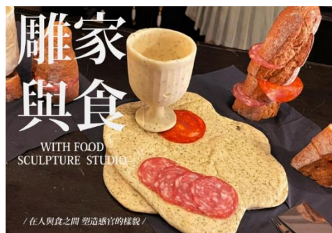
圖 7 教育部大專校院創業實戰模擬學習平臺獲補助團隊之一

在育成輔導方面，研究發展處建立創新育成輔導機制，鼓勵學生自主組隊提案，爭取更多外部資源。為有志創業的學生團隊提供諮詢與輔導服務，協助申請校外獎補助計畫/競賽/貸款，或媒合其他資源（行銷通路、進駐空間等）。輔導學生共組成 13 組創業團隊，8 隊投入大專校院創業實戰模擬學習平臺，5 組以行動學習方式體驗開關公司營運過程，並介接外部政府或民間創業資源，形塑藝術大學校園創業教育體系。