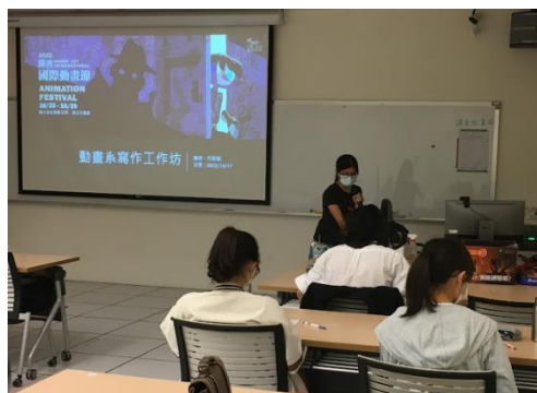
圖 11 關渡國際動畫節新聞稿寫作工作坊辦理情形

為提升學生閱讀寫作能力，於 107 年 5 月人文學院成立「人文藝術寫作中心」，辦理個別諮詢、工作坊及讀書會等，促進學生閱讀與寫作能力提升。其中「個別寫作諮詢」提供學生在遭遇寫作過程的困境中，透過不同領域元素刺激及有經驗博士生協助釐清盲點、提點可能方向；同時經由文學/文字作品薰陶，淬鍊出更精采動人的作品。從學生回饋中顯示一對一諮詢提供的對話與指引，有效協助同學釐清寫作障礙。除了辦理個別寫作諮詢，同步橫向連結校內資源，媒合學生與圖書館合作推行一對一寫作工具課；另外也與電影與新媒體學院動畫學系合作，為關渡國際動畫