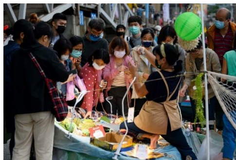
圖 16 民眾遊覽鬧熱關渡節水上市集