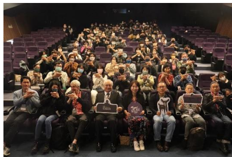
圖 13 「2022 關渡國際動畫節」閉幕式