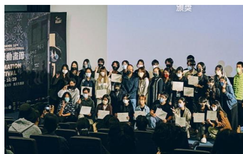
圖 6 動畫地圖、loop 動畫及動畫節開幕 動畫配樂並獲頒證書

音樂與影像跨域學士學位學程（MIT）促成音樂、影像結合之跨域合作，透過專案合作拓展師生國際跨域視野。開設「創意專案」與「音效設計導論」課程，連結動畫系課程「聲音與影像」及「聯合工坊」，兩系於課堂上培養跨領域溝通與實作能力。共完成 113 部動畫配樂，配合校慶完成「校園動畫地圖」、「甘豆風 loop 動畫」及動畫節開幕「10 秒動畫」，也於國際動畫節的「學生之夜」策劃及演出 LIVE 音樂活動。藉由跨領域課程設計，進行新型態的跨領域知識建構、轉化與創作實務。