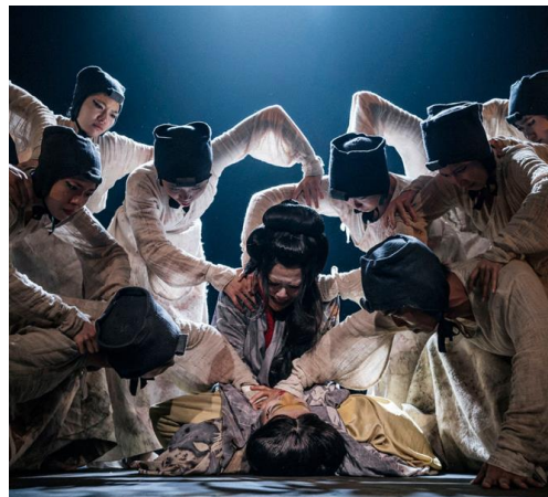
圖 3 戲劇學院春季公演《申生》演出劇照